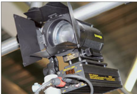
Dedolight HM4-300 mit DMX-Vorschaltgerät

Dedo Weigert hatte neben den 200-W-HMIs (NP in PP 11/06) neu das Wide Eye für die Dedolights am Stand, eine spezielle Optik, die bis auf 80°