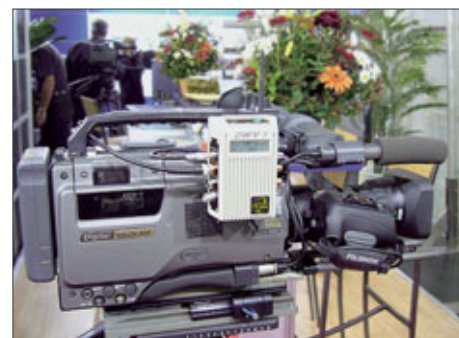
Denz DWV 1

Diversity-Empfänger kann Signale von einem Sender empfangen, der sich mit bis zu 100 Km/h bewegt. Zur Betrachtung des Bildes können auch Standard-DVB-T-Watchman-Fernseher mit einem Konverter von Denz betrieben werden. Bei der für Cine- und Video-Objektive entwickelten Schärfzeheinrichtung Studio kann