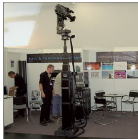
RTS Supertower 20

25 m/s ohne. Durch den Einsatz der Kabelführung kann ohne Funkstrecken in HD gearbeitet werden. Auch bei rts gibt es eine fernsteuerbare Teleskop-Hub-