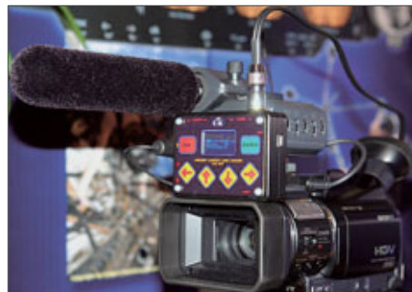
Ambient LANC Logger

Translator wurde sowohl intern als auch an der Benutzeroberfläche überarbeitet. Neben dem Display, benutzerfreundlicheren Tasten, dem Wordclock-Ausgang, zwei USB- und einem Access-Port sowie einem externen Sync-Input sind zwei neue Funktionen hinzugekommen: Bei manchen Audio-Recordingprogrammen wie z.B. dem Metacorder von Gallery Software wird die Audio-Sampling-Rate der externen Konverter nicht mit dem Timecode im Computer synchronisiert. Mit dem ACC501 erreicht man dies nun, indem man dessen Wordclock-Ausgang mit dem Wordclock-In der