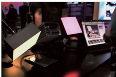
LED-Leuchten von ARRI als Technologie-Studie

Grün-Magenta (Minusgreen-Plusgreen). Damit könnten Farbfilter möglicherweise überflüssig werden. Im Theater-Modus kann mit der Basis-Lichtquelle mit