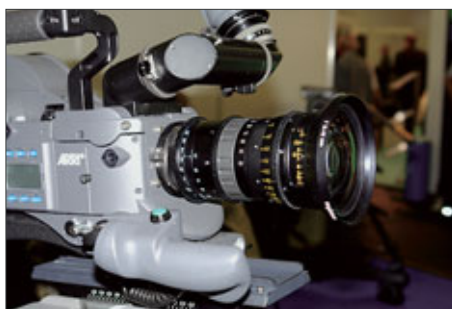
Angenieux Optimo 28-76 mm

Angenieux hatte den Prototypen des Leicht-Zooms Optimo 28-76mm mit T2.6 am Stand. Nicht fertig geworden war das Optimo 15-40mm mit T2,6. Beide wurden für 35mm-Handkamera- und Steadicam-Einsätze konzipiert und können aufgrund asphärischer Linsen trotz eines Gewichtes von unter