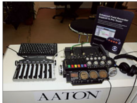
Aaton Cantar mit Acht-Fader-Erweiterung Cantarem

LANC Logger ACT601 zu sehen. Beide dienen zur Synchronisation von Audiorecordern mit Kameras und zum Loggen des Tages-Timecodes. Der bekannte Clockit-Master-Timecode-Generator und LTC-auf-MIDI-