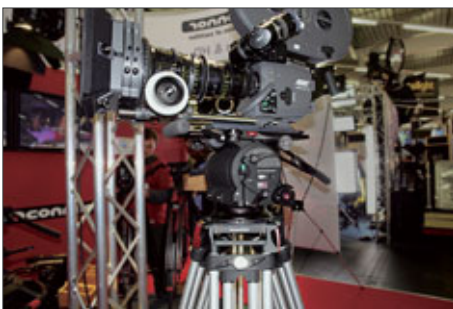
OConnor 120EX

OConnor Engineering zeigte erstmals sein neues Flaggschiff, den Fluidkopf 120EX . Das »EX« steht wie zu erwarten für »extended«, in diesem Falle für einen erweiterten Traglastbereich. Während der 120EX im Neigebereich von +/-90° maximal zwischen 14 und 54 kg ausgleichen kann, so beschränkt er bei höheren Lasten automatisch den Neigebereich, weshalb im Bereich von +/-60° mit bis zu 109 kg gearbeitet werden kann. Im Gegensatz zum 2575C ist