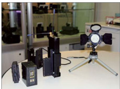
Hawk-Woods-Akkusystem, LED-Kopflicht von Pro Gear

Bei Gruppe 3 waren die kleinen Kopflampen D-75 und D-76 von Pro Gear mit 20 W bzw. 35 W (3200 K) bei 12 V bis 14 V zu sehen, die auch in Versionen für HMI-Licht als HMI-80 (10 W) bzw. mit LEDs als L60 bzw. D65 erhältlich sind. Der mittels einer Risc-CPU kontrollierte Dimmer sorgt hier u.a. für Startvorgänge, die besonders Lithium-Ionen-Akkus entlasten. Zu sehen war auch ein Akkusystem der englischen Firma Hawk-Woods für Sony-Kameras, das auch für Panasonic kommen soll. An die Akkus kann auf der Rückseite z.B. ein Empfänger angeklipst wer-